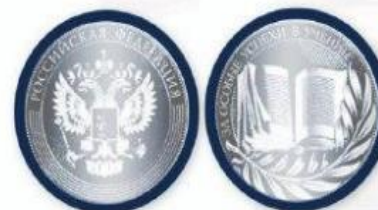
Медаль «За особые успехи в учении» II степени (серебряная)