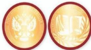
Медаль «За особые успехи в учении» I степени (золотая)