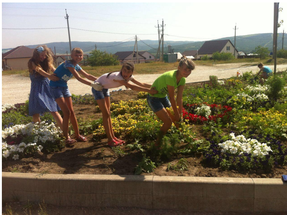
Проект «Клумба для станицы»