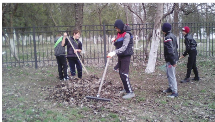
Акция «Пусть моя станица будет чистой» (уборка территории парка)