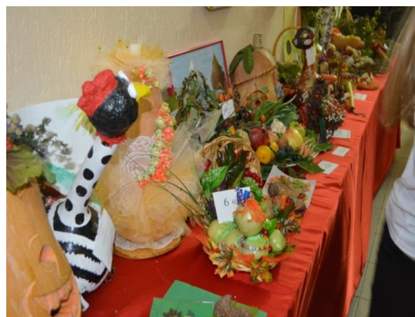
Выставка «Дары осени» ко Дню станицы