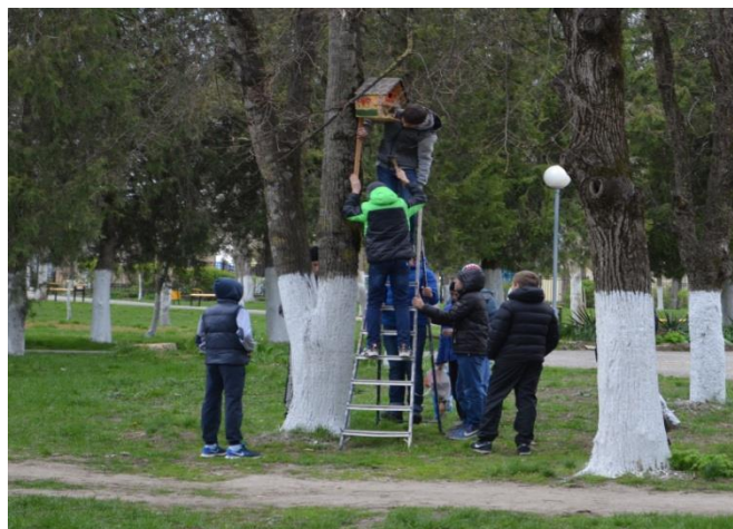
Акция «Берегите птиц» (размещение скворечников в станичном парке)