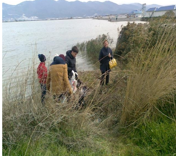
Акция «Чистые берега»