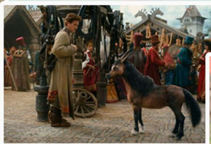
2. «Конёк – горбунок»