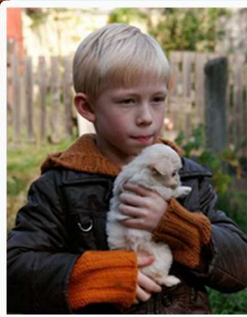
10. «Когда я стану великаном»